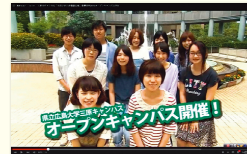
三原市チャンネルにて大学祭の告知をする学生たち

三原の「やっさ祭り」に学生も参加し、祭りを盛り上げています。また、三原市・三原テレビ放送・本大学共同で製作している三原市チャンネル「市民いきいき健康ひろば」の番組にも学生が出演し、三原市民の健康づくりに寄与しています。