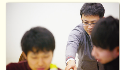
男性教員の指導の様子

学生相談室にいるカウンセラーや教員が個別面談を受け付けます。どんな悩みでも気軽に語り、相談できます。男性教員は男子学生と親睦を深め、学生生活をサポートしています。