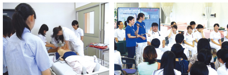
施設見学で学生が行う体験デモンストレーション