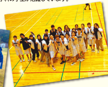
女子バスケットボール部の試合後の写真です。