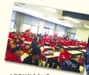
1年生はおそろいのパーカーを作りました。

毎年11月に開催される三原キャンパス大学祭(浮城祭)では、各学年ごとに模擬店を出し、ステージで出し物を披露します。