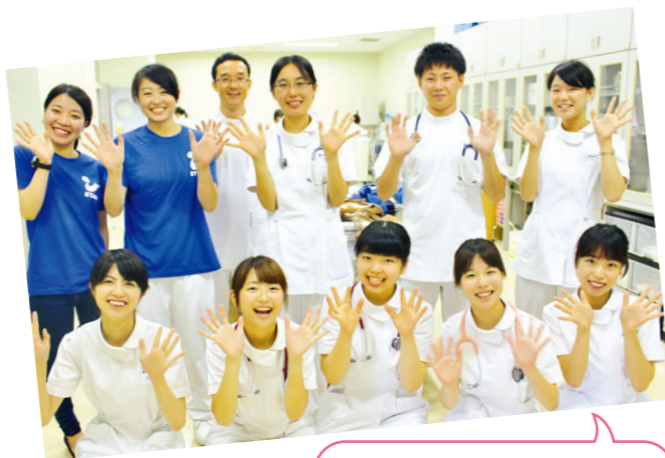
ぜひオープンキャンパスにご来場ください！

看護学科マスコットキャラクター「ナースだるま・しまなみ」です♪ 本学についてもっと知りたい場合はぜひホームページ (県立広島大学トップ→保健福祉学部→看護学科)でご覧ください。 学生や教員の活動を紹介する記事をたくさんアップしていますよ！