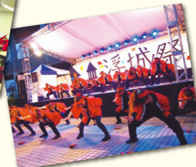
2年生では力を合わせてソーラン節を踊りました。