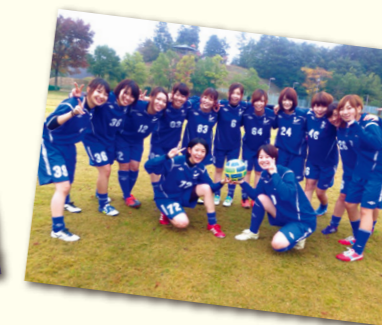
女子フットサル部は蹴球部より独立し活動しています。

走り隊、サッカー部、バスケット部、バレー部、バドミントン部、硬式テニス部、吹奏楽部、茶道・華道部、軽音部、ダンス部、ピアカウンセリング、ハーモニーサークル、ボランティア部など、数多くの体育系、文化系サークルがあり、多くの看護学科の学生が活躍しています。