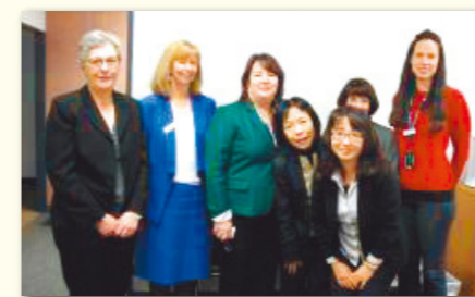
キャンベラ大学看護学科教員とともに

平成27年度オーストラリアのキャンベラ大学の看護学科との交流や病院施設でのインターンシップを含めた短期研修プログラムを計画しています。