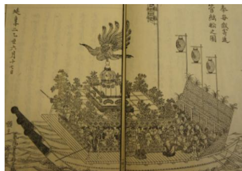
「御管絃船之図」(『嚴島絵馬鑑』巻四)