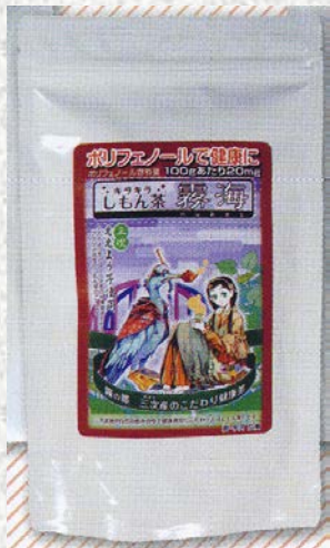
しもん茶「霧海(むかい)」 (ブラジル原産の白いサツマイモの葉と茎から作ったお茶。機能性成分が多く含まれている。)