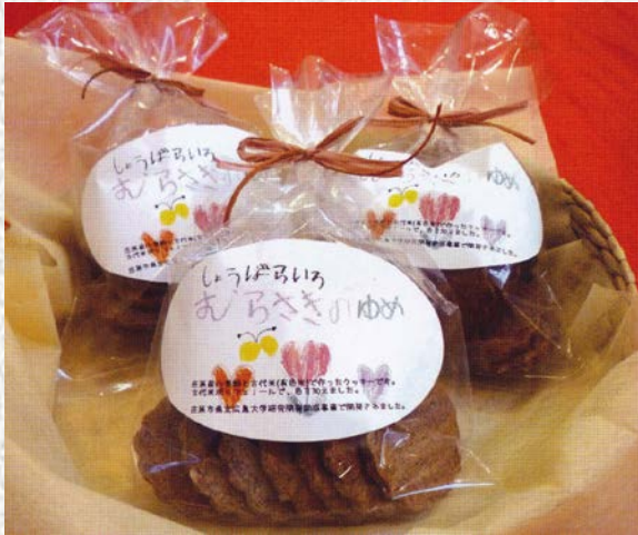
しょうばらい むらさきのゆめ (有色米ポリフェノール入りクッキー)