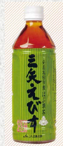
三矢えびす「ハブ草茶」 (県北地域で親しまれてきた健康茶で、風味がよく、ポリフェノールが多く含まれている。)