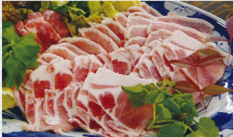
どんぐりコロコロ豚(とん) (餌にどんぐりを混ぜ、放牧して育てた豚)