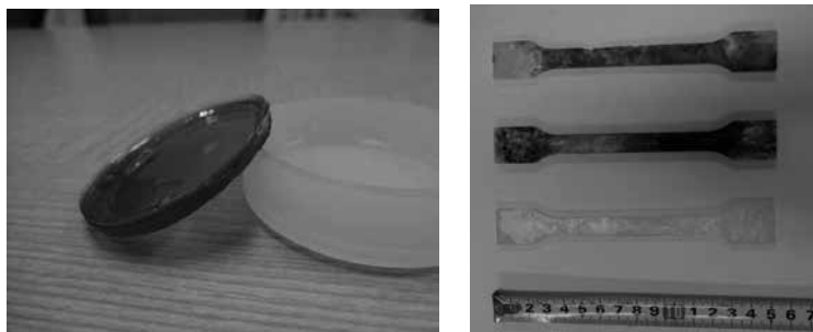
図 2 (左) DCM 溶液からの LAnis4Me-PS キャストフィルム (15%), (右) 万力加熱プレス機を用いた JIS K7139 金型による熱圧成型試料 ( 200^\circ\text{C} , 20 分圧縮, 厚さ 4 mm)。

POLAnis4Me ならびに POLAnis4MeOAc との PS ポリマーブレンドを小型の金型に入れ万力熱圧プレス 200^\circ\text{C} で 30 分加熱し成型したところ褐色の透明な成形体として得られた。