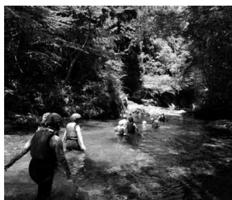
図1 清流セラピー（仮）紹介プレゼン

その結果、大学生にとって湯来町の観光地としての認知度は極めて低く、一部の学生においては温泉地（湯来温泉）としてよりも有名漫画（スラムダンク）のシーンで使用された温泉宿の印象がある程度であった。詳細は割愛するが、実際は自然を用いた体験交流の場としてかなり整備が進められており、大学生にとってもレジャーとしての魅力が多い場所でもあるにも関わらず周知が不十分であることが示唆された。また、運営側が目指す“清流セラピー”の効果は「健康増進」であるが、手本となる先行の“海浜セラピー”では、健康増進の手法としてリラクゼーション（癒し）を重視しており、大学生もそのように認識していた。しかし、現行の“清流セラピー”はシャワークライミングの要素が強すぎるため、大学生も違和感を感じる結果となった（図2）。この結果は今後の“清流セラピー”のあり方については大き