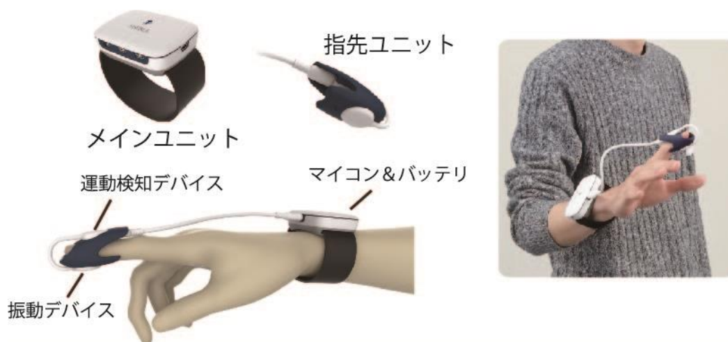
図2 開発した小型転倒予防装置：指先に装着する3軸加速度センサと小型の振動子部、手首に装着するマイコンとバッテリーから構成される。