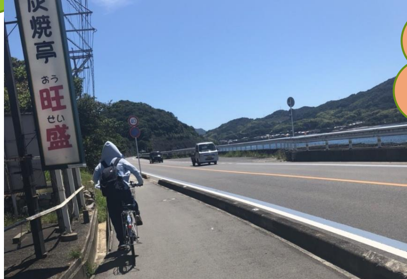
サイクリングで海 を一望！！