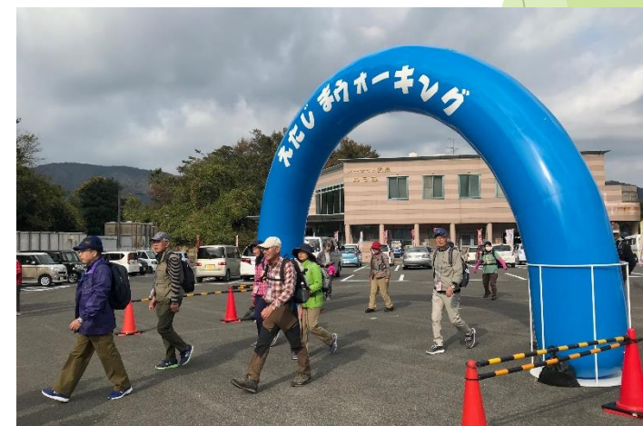
江田島ウォーキング