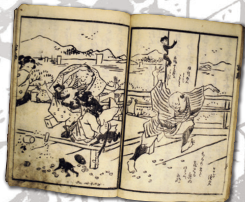
「滑稽道中宮島土産」(個人蔵)